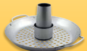
Hähnchenrost & Gemüsewok